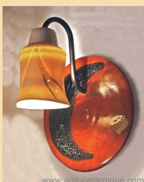
Applique murale porcelaine "Luna"

Les photographes Claire et Jean-Marie LACHARPAGNE réalisent pour La Yourte leur première exposition commune : « Visages de l'Inde », une série de portraits réalisés lors de leurs récents voyages en Inde. Professeurs à l'étranger, ils ont profité de leurs séjours à Madagascar, Côte d'Ivoire, Togo, Turquie pour rapporter de nombreuses images. Celles de Jean-Marie furent déjà présentées lors d'expositions, d'Istanbul à Montpellier, en passant par Cahors, Beauvais etc.