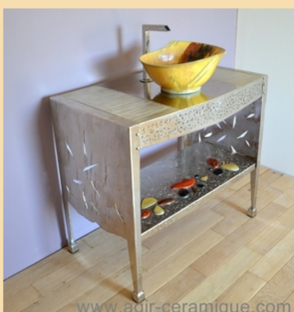
Meuble lavabo "Lotus"