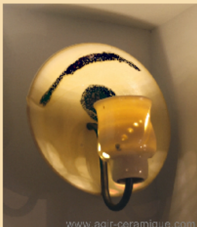
Applique murale porcelaine "Crépuscule"

La Yourte 9 rue des Balances – 34000 Montpellier 04 67 66 29 46 - 06 71 35 43 20 expo du 10 au 25 Décembre 2014 vernissage le 11 décembre 18h finissage le 20 décembre 18h