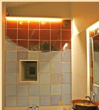
Carrelage salle de bains et lavabo